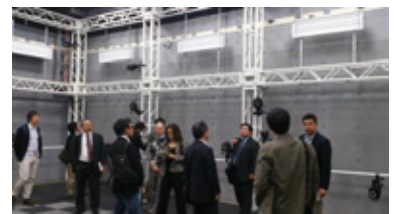
モーションキャプチャスタジオ