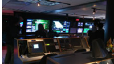
コントロールルーム