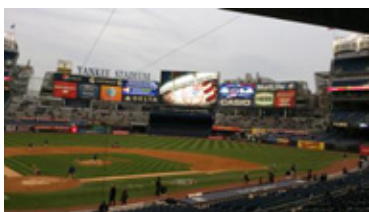
これぞボールパーク

新ヤンキー・スタジアムは、ニューヨーク・ブロンクス区に2009年に建設された野球場。